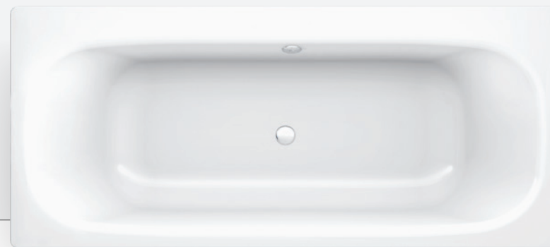
UNIVERSAL DUO HG

АССИМЕТРИЧНАЯ ФОРМА: ОДНА СТОРОНА ВАННЫ ПРЕДСТАВЛЯЕТ СОБОЙ УДОБНУЮ ПОЛОЧКУ ДЛЯ ВАННЫХ ПРИНАДЛЕЖНОСТЕЙ И СЛУЖИТ ИДЕАЛЬНЫМ ВАРИАНТОМ ДЛЯ УСТАНОВКИ КРАНОВ И ДРУГИХ ПРИСПОСОБЛЕНИЙ, В ДАННОМ СЛУЧАЕ – РУЧНОГО ДУША И СМЕСИТЕЛЕЙ. УНИВЕРСАЛЬНОСТЬ АССИМЕТРИЧНОЙ МОДЕЛИ UNIVERSAL DUO ПОЗВОЛИТ ВАМ НА ВАШ ВКУС ВЫБРАТЬ ПОЛОЖЕНИЕ КРАНОВ, КОТОРЫЕ МОЖНО РАЗМЕСТИТЬ НА БОРТИКЕ ВАННЫ.