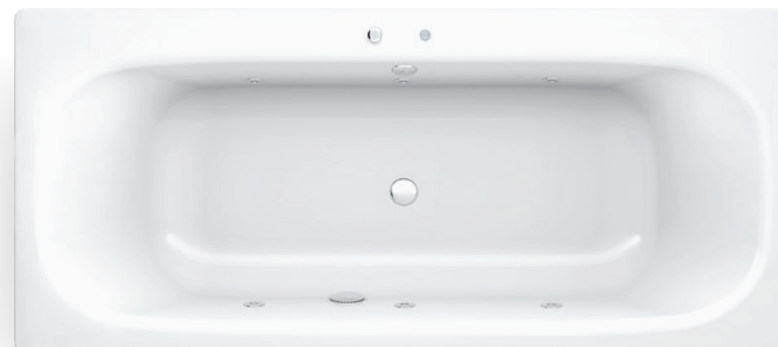
UNIVERSAL DUO HYDRO HG